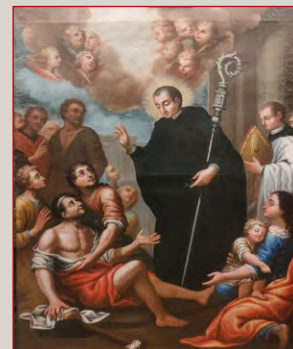
San Tommaso da Villanova Elemosiniere, olio su tela, sec. XVIII.