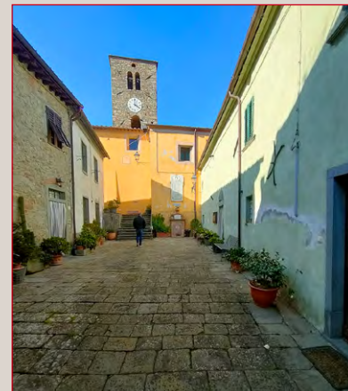
Valleriana, piazza Aramo.

Inviteremo tutti i cittadini, le associazioni e gli appassionati di storia e territorio a partecipare: insieme possiamo contribuire a costruire una Valleriana più coesa, viva e consapevole, dove ogni piazza e ogni castello diventa punto di incontro, conoscenza e condivisione. Perché la Valleriana non sia solo un'area da visitare, ma in primo luogo un patrimonio da vivere.