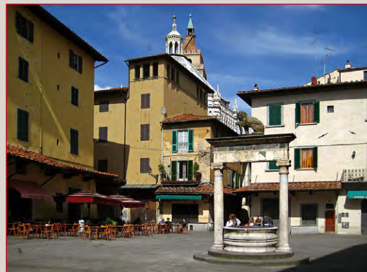
Piazza della Sala.

Oggi è sede del Liceo “Carlo Lorenzini” al cui interno si trova La Pinacoteca inaugurata nel 2009 ed inserita nel percorso museale della città.