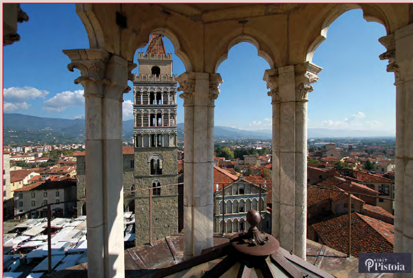
Pistoia, vista dal Battistero di San Giovanni in corte.

Istanze che potrebbero assumere più pregnanza e rilievo, se l'espressione della comunità culturale, in primis nelle sue forme associative, è tale da creare un circuito virtuoso di coinvolgimento attivo