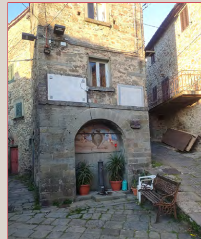
Valleriana, piazza Sorana.

Un aspetto centrale del progetto mira al coinvolgimento dell'associazionismo locale. Vogliamo dare voce alle realtà culturali, artistiche e sociali che operano nei borghi, creando sinergie e una visione comune per tutta la Valleriana. Solo attraverso la collaborazione e la partecipazione attive pensiamo che sia possibile dare un senso unitario a questo territorio, valorizzandolo nelle peculiarità di ciascun borgo, ma senza frammentare l'esperienza complessiva della valle.