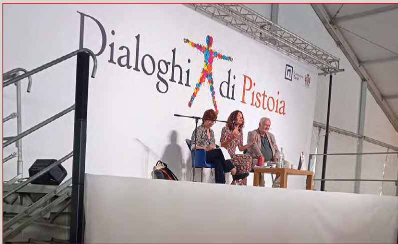
Evento: Dialoghi di Pistoia (2025).

Infatti, dalla lettura in controluce delle risposte alle domande, sembra emergere l'auspicio – soprattutto per gli organizzatori dei grandi eventi – di prestare più ascolto alle istanze e alle proposte, provenienti dalla variegata