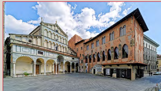
Pistoia, Cattedrale e Palazzo dei Vescovi

Insomma un impegno ad avere cura di un modello di sviluppo più armonico per Pistoia e il suo territorio.